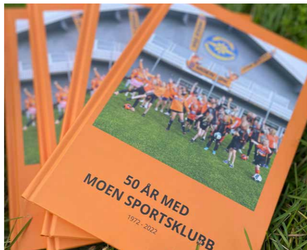
Jubileumsbok - Moen Sportsklubb

Etter 10 år med rentefall, snudde eiendomsmarkedene nedover i 2022. Tross et godt utleiemarked med økte leiepriser og lav ledighet, var dette ikke uventet. Hovedgrunnen til fallet i markedet er knyttet til økte finansieringskostnader og økt avkastningskrav. Det er foreløpig lav aktivitet i transaksjonsmarkedet grunnet usikkerhet rundt hvor verdiene skal ligge. Fremover vil utviklingen i eiendomsmarkedet være avhengig av utvikling i norsk økonomi, inflasjon og renteutvikling.