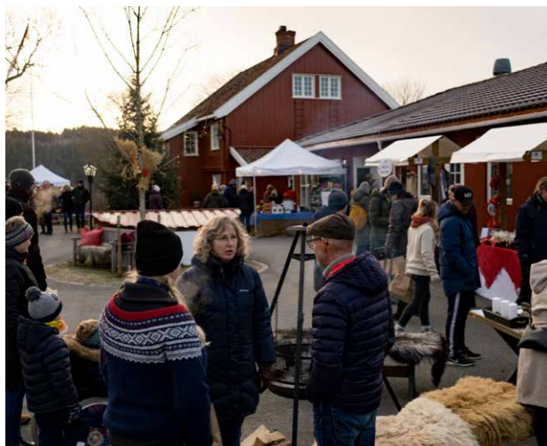
Julemarked på Granavollen.