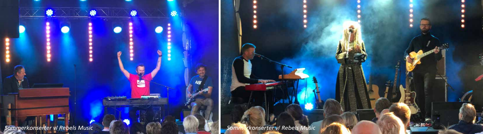
Sommerkonsert v/ Rebels Music