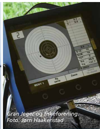
Gran Jeger og fiskeforening.