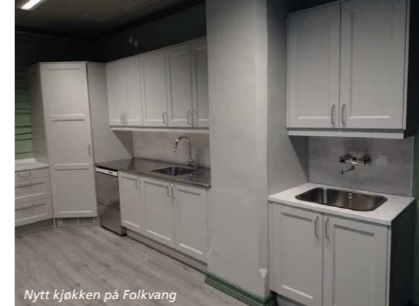
Nytt kjøkken på Folkvang