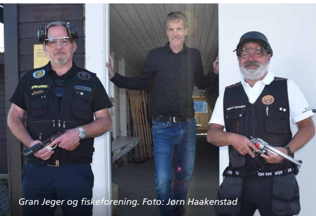
Gran Jeger og fiskeforening.