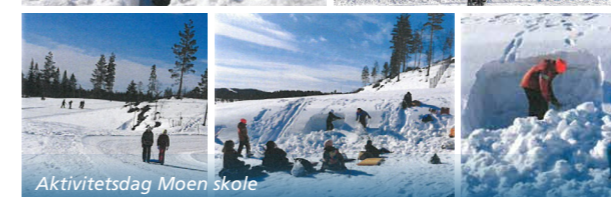
Aktivitetssdag Moen skole