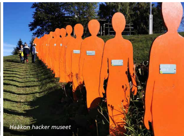
Haakon hacker museet